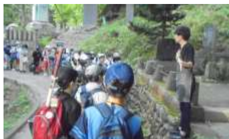
しっかり話を聞きます