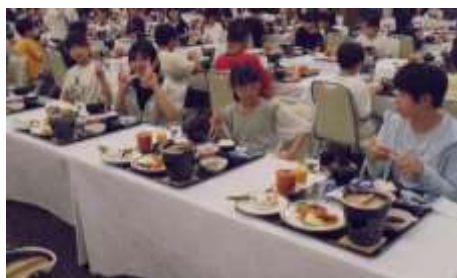
みんなで食べるごはんは最高！