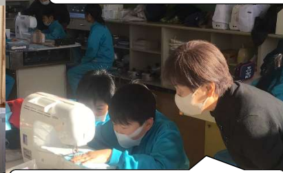
1/ 15,17,18 婦人会 ミシンの指導（5年） 地域協働事業

人権擁護委員の方から、人権とは「みんなが笑顔で学校に通える権利」というお話がありました。特に、いじめについては「人が嫌がることはいじめ」「黙っていることはいじめ」と強調され、「人の気持ちを考える」事の大切さを学びました。