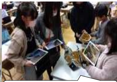
グローブを手に写真撮影！