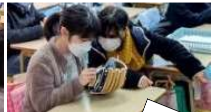
サインついでる！ 「野球しようぜ！」だって！