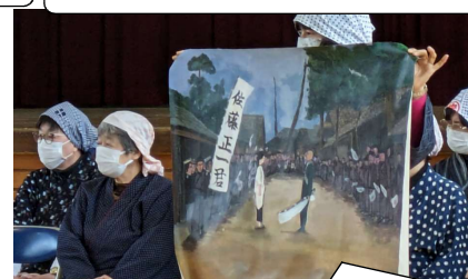
1/22 白萩の会・平和学習（6年）

毎年恒例、増田西地区婦人会の方々による5年生へのミシンの指導。婦人会の方がいればミシンにつきもののトラブルも怖くありません。みんな丁寧にランチョンマットを仕上げることができました。