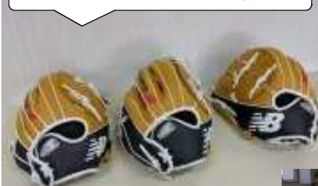
1/16 ついに大谷のグローブが増西に！