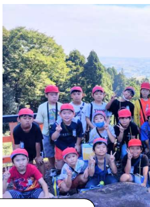
3年校外学習 熊野那智神社