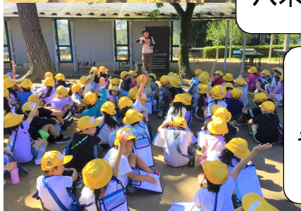
2年校外学習 うみの杜水族館